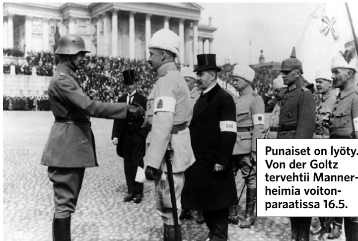
Punaiset on lyöty. Von der Goltz tervehtii Mannerheimia voitonparaatissa 16.5.

Sisällissodan taistelujen päättyttyä toukokuun alussa 1918 saksalaiset joukot eivät palanneetkaan kotimaahansa. Itäme-