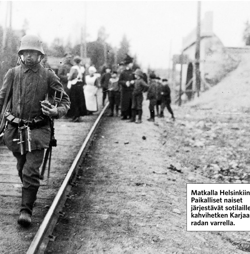
Matkalla Helsinkiin. Paikalliset naiset järjestävät sotilaille kahvihetken Karjaanradan varrella.

ren divisioona, noin 13 000 miestä, jäi Suomeen perustamaan armeijaa, josta oli määrä tulla ”Pohjolan teräsnyrkki”. Sen tehtävänä olisi ollut Saksan sotilaallisten intressien puolustaminen Koillis-Euroopassa.