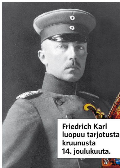
Friedrich Karl luopuu tarjotusta kruunusta 14. joulukuuta.