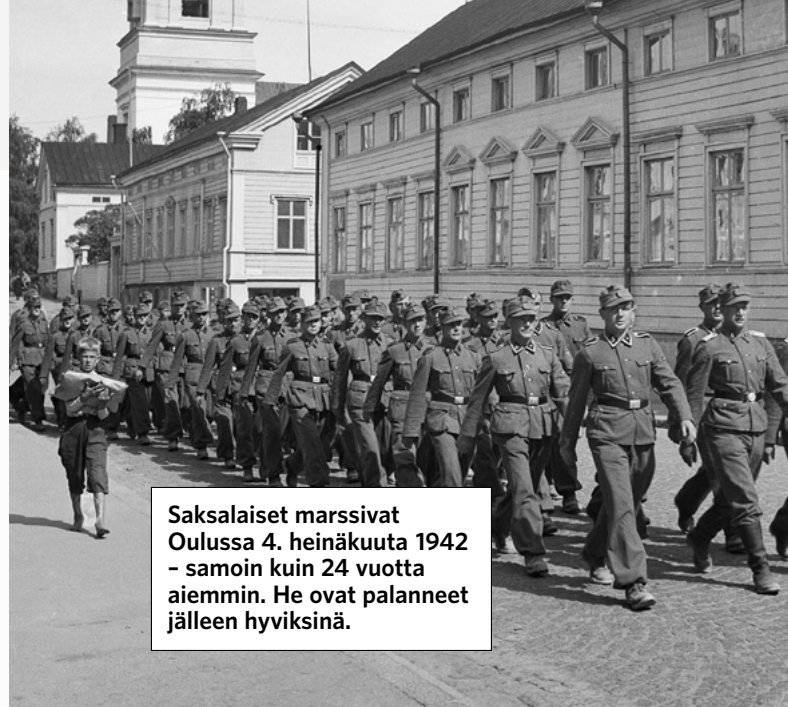
Saksalaiset marssivat Oulussa 4. heinäkuuta 1942 - samoin kuin 24 vuotta aiemmin. He ovat palanneet jälleen hyväksiniä.

Maaikmansotien aloittajaksi ja syypääksi tuomittu Saksa oli pitkään kansainvälisen politiikan